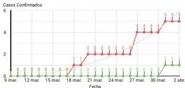
Evolución del consolidado de casos confirmados y recuperados de coronavirus en Nicaragua